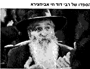
הספדו של רבי דוד חי אביחצירא

"האישה שחשפה את הפרשה - צעירה בשנות ה-20 לחייה - נזקקה לתעזומות נפש גדולות כדי לחשוף את הפרשה", סיפר עורך-דין עמי סביר, שמייצג את האישה שחשפה את הפרשה, "היא לא הייתה מעורבת בכל התהליכים, אלא הייתה עדה למעשים לאחר שחיפשה משמעות ותוכן בחייה ונתקלה בחשוד. היא הייתה עדה הן לכריזמה שלו והן למה שהיום היא מבינה שהן זוועות".