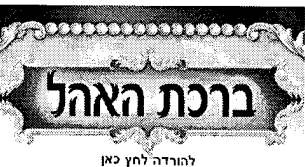
להורדה לחץ כאן