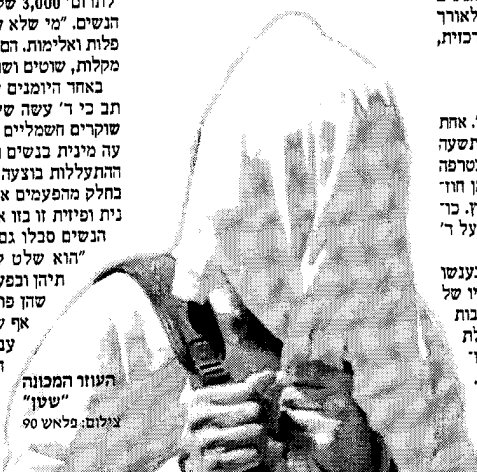
העוזר המכונה "שטן"

סיפרה הצעירה שנמלטה מהכת. "היה פחד קבוע מהתגובות של ד' ושל העוזר שלו. הם היו מכריחים אותנו להתוודות על מחשבות על גברים אחרים וכינו את זה 'נגידה'. ד' היה מקיים שיחות טרדי קבוצתיות שכללו השפלות, צעקות בלתי פוסקות ועונשים שקייבלנו לעיני הילדים. אלה הדינים" שלו. בעת ההתכנסויות הוא אילץ אותנו לספר על חוויות מיניות מהעבר. באחד הימים, כשחשדו