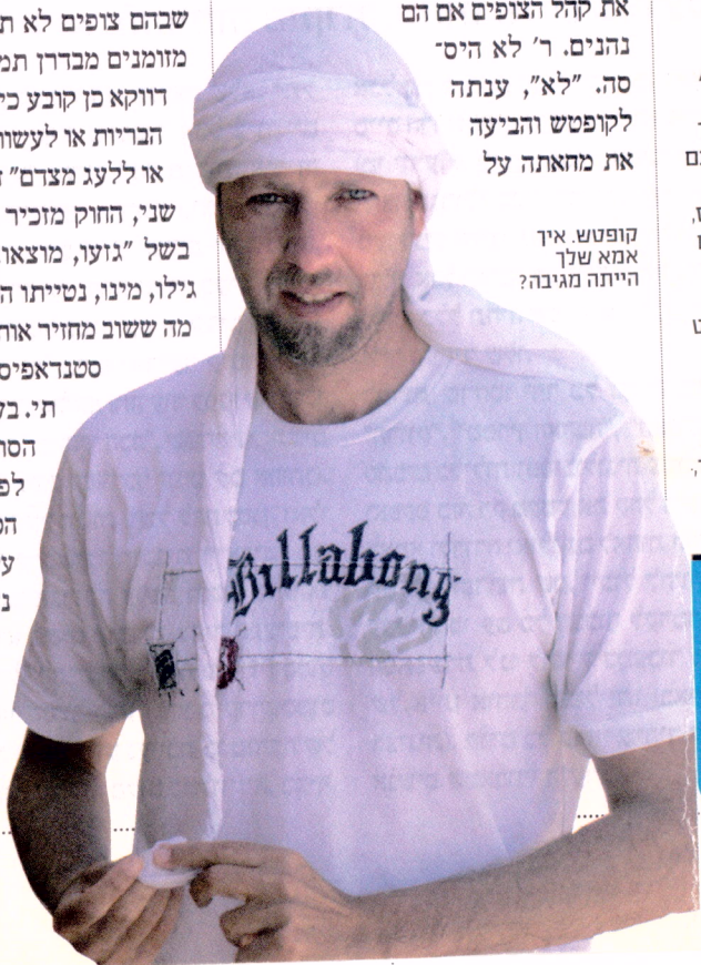
קופטש איך אמא שלך הייתה מגיבה?

בשלב מסוים פנה הסטנדראפיסט ושאל את קהל הצופים אם הם נהנים. ר' לא היססה. "לא", ענתה לקופטש והביעה את מחאתה על